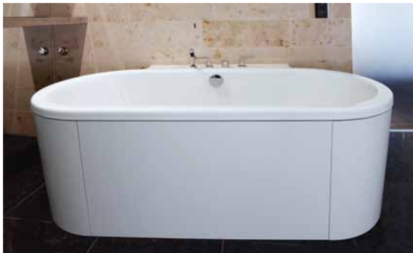
HOTEL THE DOLDER GRAND, ZÜRICH

TECHNISCHE ZEICHUNGEN FINDEN SIE UNTER WWW.GABAG.COM